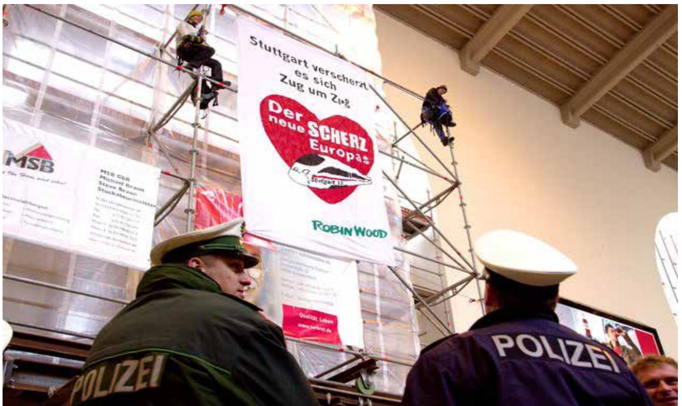
Echter Protest gegen Stuttgart 21