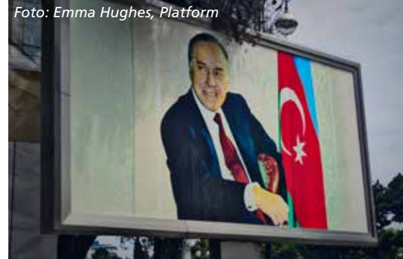
Heydar Alijew, ehemaliger Präsident Aserbaidschans: Profi im Protestmanagement

nesty International, Greenpeace, Open Society Institute und der WWF gezählt. Mit diesen müsse man sich ernsthaft auseinandersetzen, aus Legitimations- und Reputationsgründen. Zu den „Polarisierern“ gehören kleinere radikalere Gruppen wie CEE Bankwatch, Friends of the Earth oder das Corner House. Mit ihnen solle nur „opportunistisch“ interagiert werden. Im wesentlichen ging es darum, diese radikaleren Organisationen zu neutralisieren. Konkret hieß dies etwa, dass BP Programme des Open Society Institut in Aserbaidschan nur fördern wollte, wenn ausgesprochene KritikerInnen nicht involviert würden.